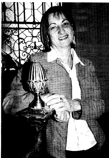
Loretta Napoleoni, autora del libro 'Yihad'.

Se ha hablado mucho de los terroristas de Al Qaeda sacaron